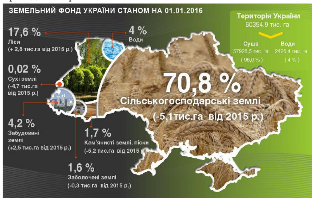
Рис. 1. Земельний фонд України станом на 01.01.2016 р.

За обсягом придатних для сільськогосподарського виробництва земельних ресурсів Україна – одна з найбагатших країн світу. На душу населення в Україні припадає 0,9 га сільськогосподарських угідь, в т. ч. 0,7 га ріллі. За європейськими мірками показники землезабезпечення в Україні досить великі. Незважаючи на значні ресурси, раціональне використання землі – одне з найважливіших національних завдань. Проблема й у тому, що в Україні дуже високий рівень залучення земель у сільськогосподарський оборот: сільськогосподарське освоєння території – 70,8 %, розораність с.-г. угідь – 78 % або 56 % території. Структура земельного фонду України станом на 01.01.2016 р. подана на рис. 1.